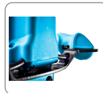
Régulateur de vitesse électronique