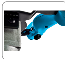
2 modes de vitesse : lent / rapide