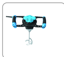
Poignées ergonomiques avec revêtement soft-grip.