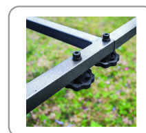
Châssis démontable sans outil