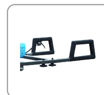
Poignées avec revêtement grip