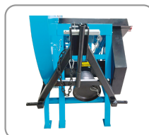
Attelage 3 points et entraînement sur prise de force.