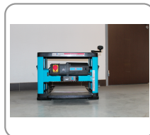
Table de rabotage en acier galvanisé