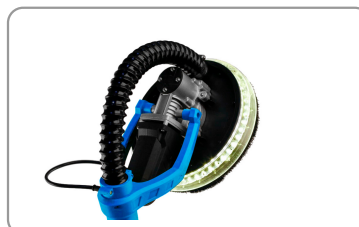
Eclairage led sur la tête de ponçage.