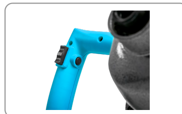
Bouton de déverrouillage