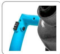
Bouton de déverrouillage