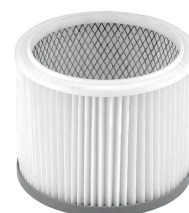
Filtre cartouche lavable HEPA