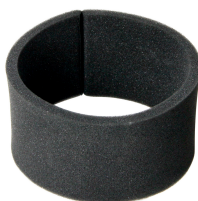
Filtre en mousse pour liquides