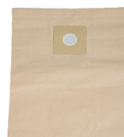
Sac filtre papier (lot de 5 pièces)