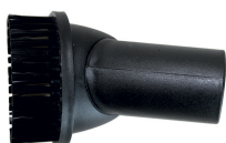
Brosse ronde Ø 60 mm