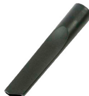
Suceur plat droit