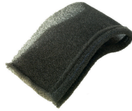
Filtre en mousse pour liquides