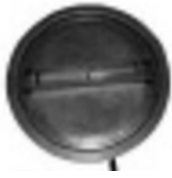
Chapeau de blocage filtre HEPA