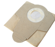
Sac filtre en papier 20 L (lot de 5 pièces)