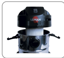
Filtre permanent en cartouche lavable