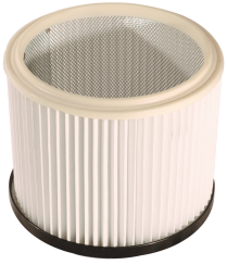
Filtre cartouche lavable