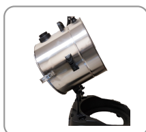
Cuve basculante pour l'évacuation des déchets