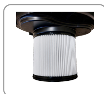
Filtre plissé hepa