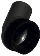
Suceur à liquides 360mm (Ø38mm)