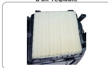
Décolmatage automatique par impulsions