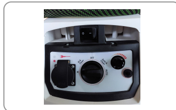
Prise synchronisée pour appareil électroportatif, débit d'air réglable