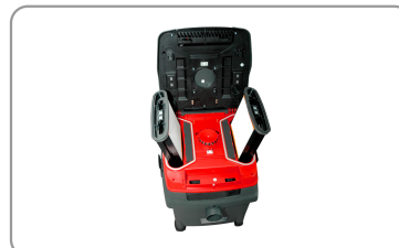
Deux cassettes à filtre en polyester classe m