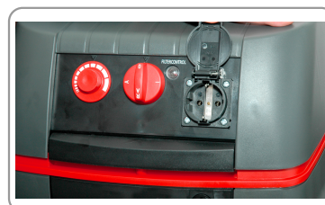
Synchronisation avec machine électroportative