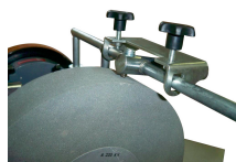
Redresse meule diamanté