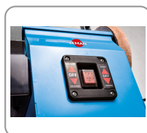
Interrupteur marche/arrêt avec sélection du sens de rotation