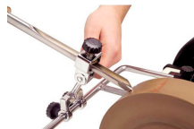
Dispositif d'affûtage pour gouges