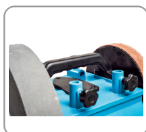
Poignée de transport