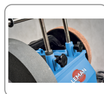
Support universel en f Ø 12 mm avec molette de réglage