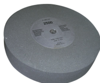
Meule corindon Ø 250 mm grain 220