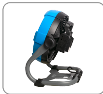
2 vitesses de ventilation réglables.