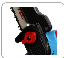
Changement de lame rapide et facile.