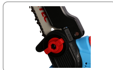
Changement de lame rapide et facile.