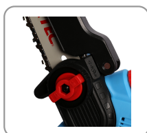
Changement de lame rapide et facile.