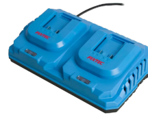
Chargeur rapide de batterie 20V Li-Ion