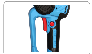
Compacte, légère, pratique et maniable.