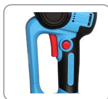
Compacte, légère, pratique et maniable.