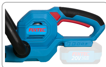
Poignée principale ergonomique avec revêtement caoutchouc.