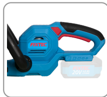
Poignée principale ergonomique avec revêtement caoutchouc.