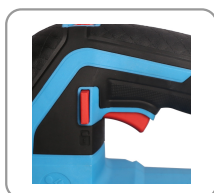
Gâchette de démarrage avec bouton de déverrouillage.