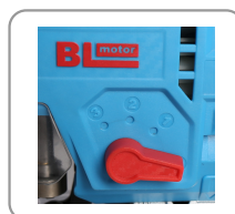
Mouvement pendulaire à 4 positions.