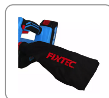
Sac de récupération des poussières positionnable à droite ou à gauche.