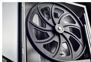
Volants en fonte d'acier équilibrés