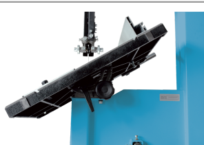
Table inclinable à 45°