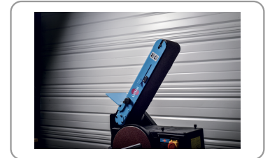
Bande orientable de 0° à 90°