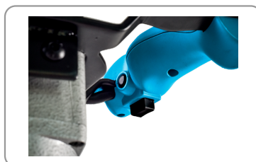
2 modes de vitesse : lent / rapide