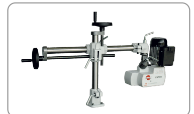
Bras rallongé de 610 mm