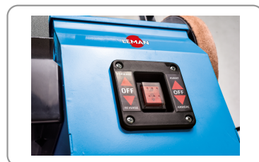
Interrupteur marche/arrêt avec sélection du sens de rotation