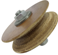
Disque de démorfilage pour gouges