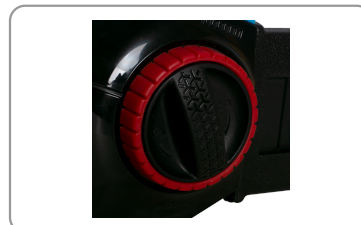
Blocage du guide et tendeur de chaîne.