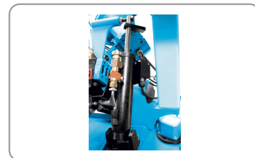
Discesa dell'archetto con martinetto idraulico regolabile