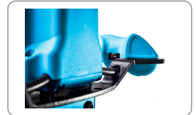
Regolatore di velocità elettronico