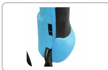
Molette de réglage.