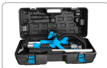
Livré avec une mallette de rangement