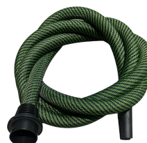
Tuyau flexible d'aspiration à gaine lisse (4m)