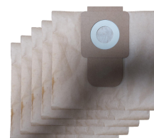
Sac filtre en papier (lot de 5 pièces)