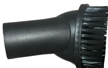
Brosse demi-ronde (Ø32mm)