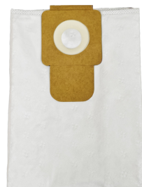
Sac filtre non tissé en polyester