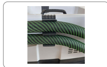
Flexible d'aspiration à gaine lisse renforcée