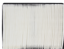
Filtre plissé HEPA E11 lavable