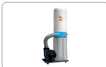
Sacchetto filtrante in feltro