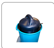
Maniglia per il trasporto