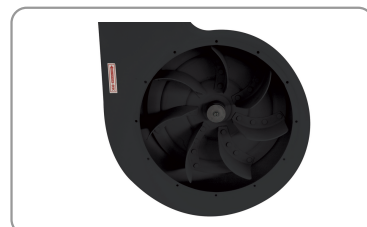
Elica in acciaio