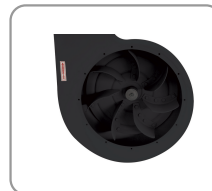
Elica in acciaio