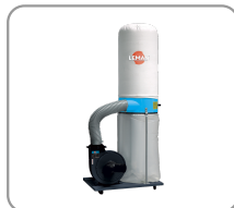
Sacchetto filtrante in feltro