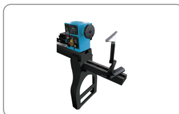
Prolunga e supporto utensile esterno