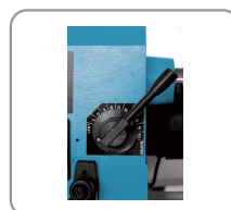
10 velocità da 500 a 2000 giri/min