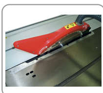
Carrello a filo lama da 2000 mm