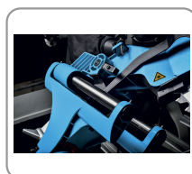
Testa a scorrimento radiale