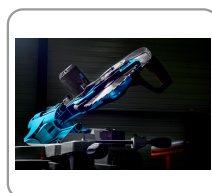
Testa inclinabile di 45° a destra e a sinistra