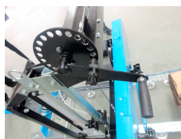
Manovella per la regolazione dell'altezza di taglio