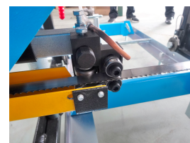
Guida e protezione della lama regolabili