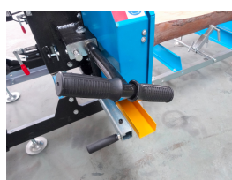
Maniglia di regolazione della tensione della lama