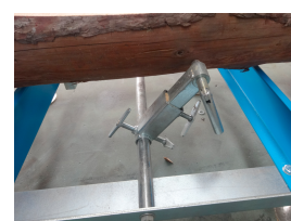
Sistema di mantenimento dei tronchi