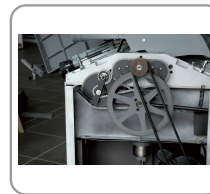
Alimentazione rulli a catena, trasmissione motore a doppia cinghia