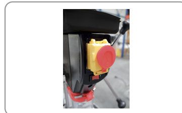
Pulsante di arresto demergenza a fungo