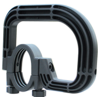
Maniglia per il trasporto