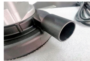
Sistema di aspirazione