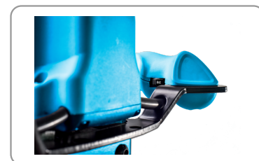
Regolatore di velocità elettronico