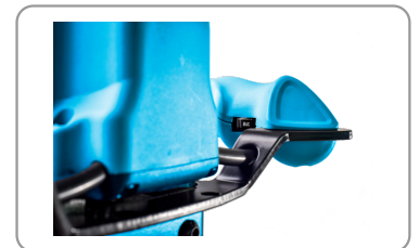
Regolatore di velocità elettronico