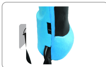
Molette de réglage.