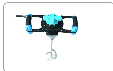
Poignées ergonomiques avec revêtement soft-grip.