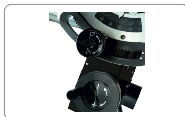
Lama inclinabile a 45° e regolabile in altezza