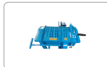
Protezione superiore con maniglia regolabile