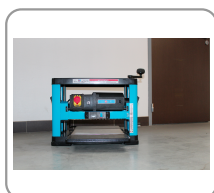
Banco di piallatura in acciaio zincato