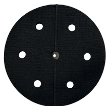
Platorello velcro Ø 215 mm