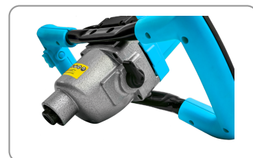
2 velocità : lenta/rapida